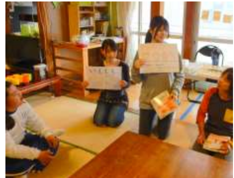
子どもたちに説明するスタッフ