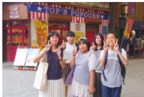
(大須の商店街を散策中)

10月8日はとても長い 歴史と意思のこもった「なないろコンサート」、(名古屋市中村区)は午前中少し練習してから「大須」に出かけショッピングと昼食、夜もみんなで夕食を食べ楽しい1日でしたが、なんと知多半島F大学4年スタッフ2名が「初!大須」だったので、大須の町を子どもたちが道案内役をしてくれました(笑)また「なないろコンサート～」には子ども達の親御さん、兄弟、おじいちゃんおばあちゃんが応援に来て下さいました。