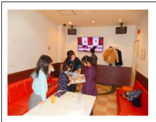
カラオケ101の3部屋を借りました。