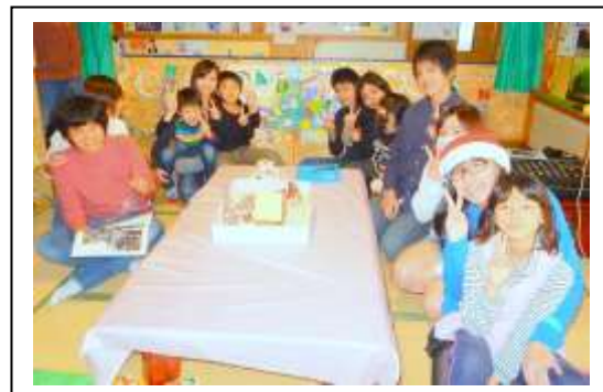
生徒会代表さんと一緒に