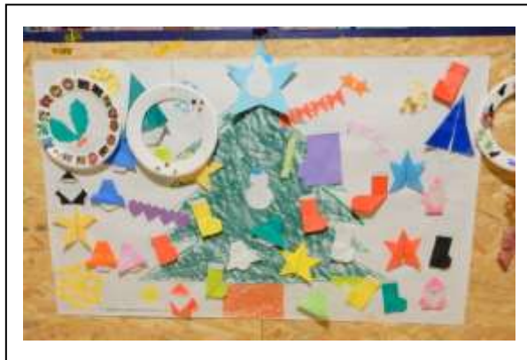
半田商業高等学校定時制生徒会さんの作品