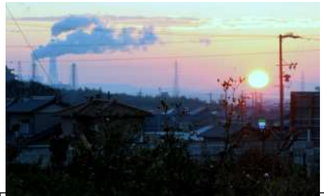
緑丘小学校西方面に300m程の場所にある 借地(約1,000坪)から見た初日の出 春からここで「小さな大豆畑」を耕作 する予定です。