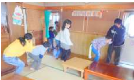
とても上手に出来た避難訓練でした