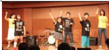
びいーぼの子ども・兄妹ダンス

5月28日(土) 16時～18時半 武豊町民会館ゆめたろうプラザ ～響きホール～