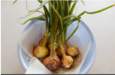
子ども達と収穫した新玉ねぎ