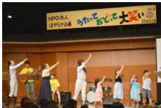
「手話歌」と生演奏のステージは ～dream☆姫～

今回は、この元気で素敵な子どもたちと、広がった団体や地域の方々と一緒に“子どもも大人もみんなが主人公になって会場いっぱい歌と踊と大笑いの楽しい劇を企画しました！