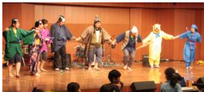
職員による時代劇のカーテンコール風お礼場面